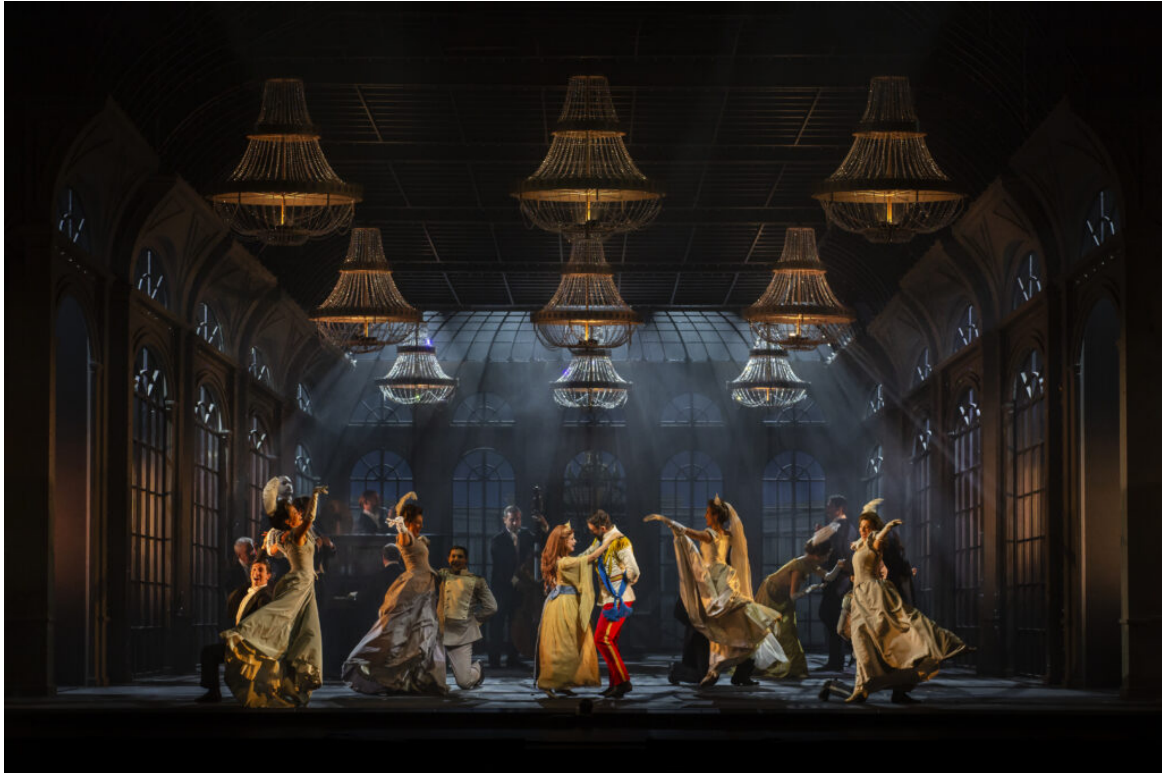
Un momento di Anastasia il Musical

Dalla squadra di Broadway Italia nonché produttori di The Phantom Of The Opera, Anastasia vuole essere una favola capace di coinvolgere il pubblico di ogni età e appassionarlo alla storia vera.