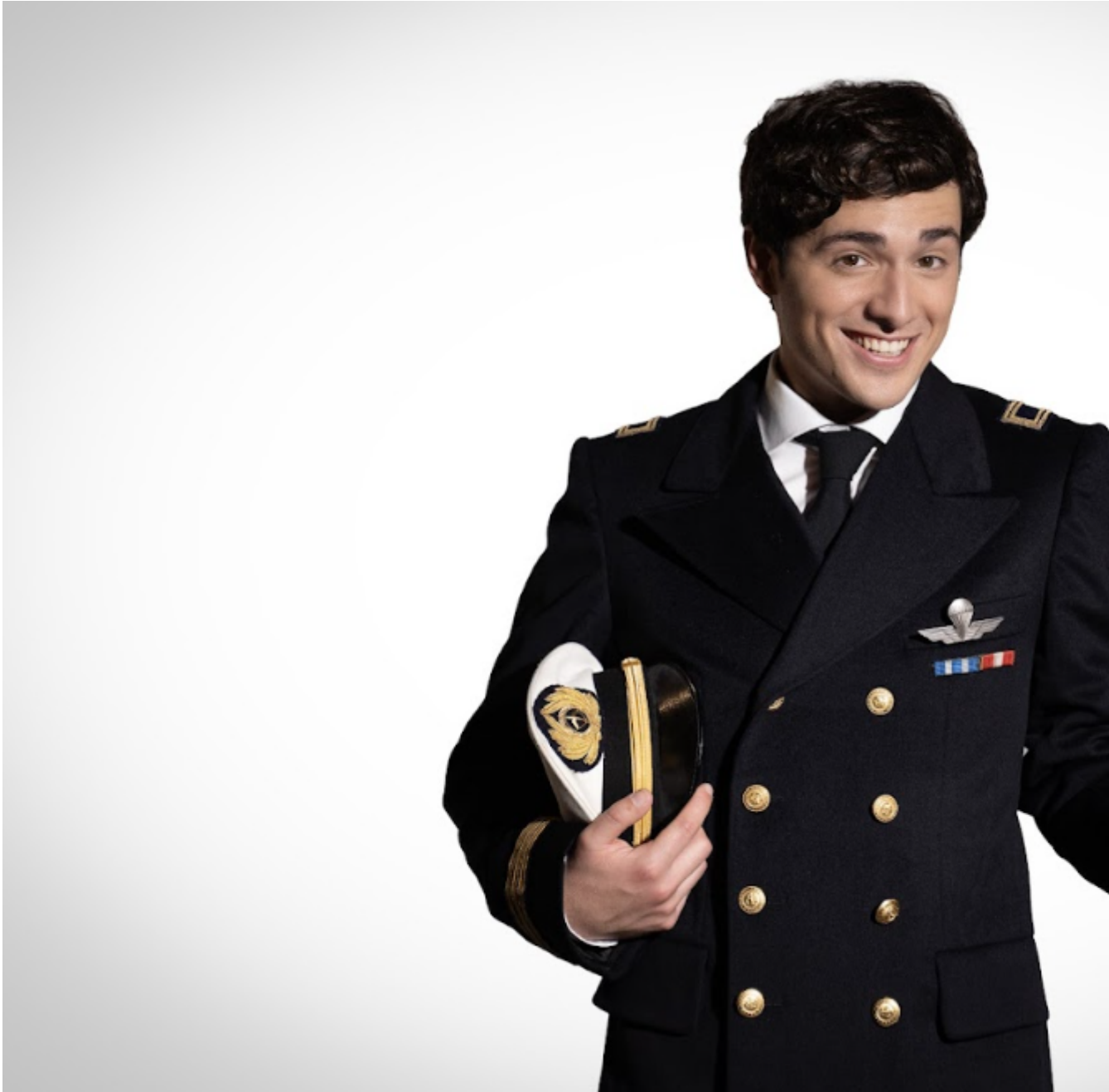
Tommaso Cassisa/ ph.ufficio stampa