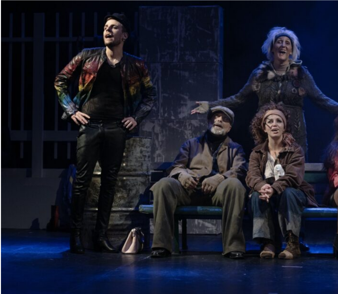
NIENTE un musical, al Martinitt martedì 30 gennaio.

“NIENTE” è lo specchio di una realtà sommersa dai pregiudizi e dalla diffidenza, la dura realtà di chi è costretto a fare i conti con la fame, il freddo, l’indifferenza e la solitudine, cadendo spesso nel vortice della disperazione, dell’alcoolismo e della depressione. Si trattano temi come l’abbandono, l’omofobia, la violenza e la droga oltre alla condizione di povertà che regna nella quotidianità della vita degli “inesistenti” della nostra società.