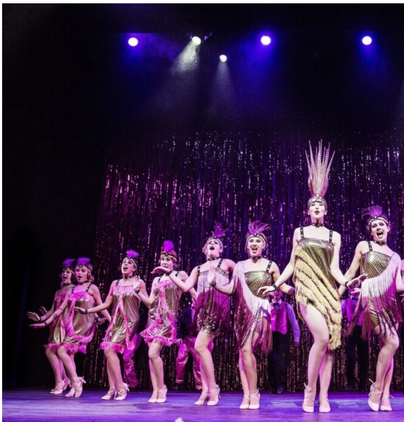
CHAPEAU IL MUSICAL