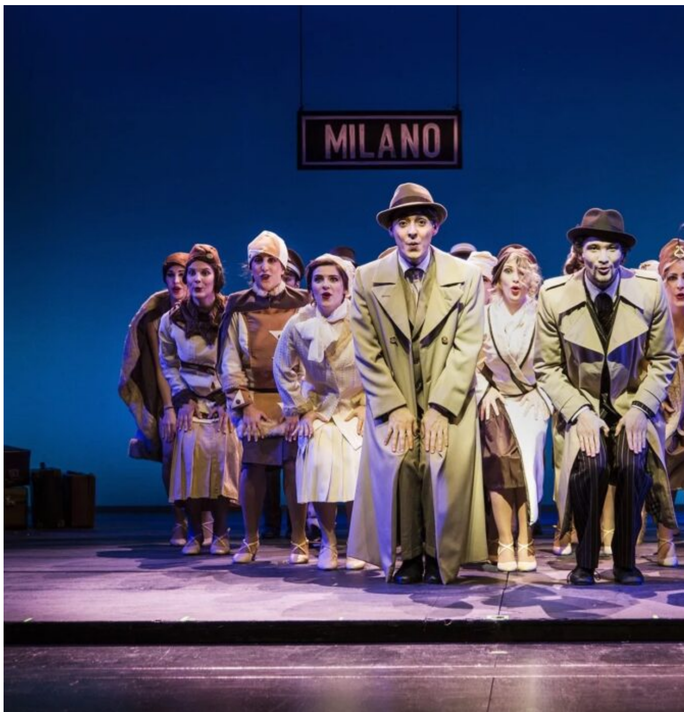
CHAPEAU IL MUSICAL

E ancora le immaginifiche creazioni di MIDSUMMER NIGHT'S CIRCUS, il musical ispirato al Sogno di una notte di mezza estate di William Shakespeare e il mondo hippy e coloratissimo di HAIR – The Tribal Love Rock Musical, nato come saggio MTS – MUSICAL! THE SCHOOL e divenuto poi spettacolo professionale di grande successo prodotto da MTS ENTERTAINMENT.