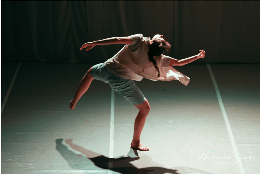
Beatrice leni-ph. Alessandro Ossidi-Fatidiche Riesumazioni-Youth Festival 2024

attraverso la produzione, promozione e organizzazione di un festival multidisciplinare. I partecipanti seguono un percorso formativo che include la visione di eventi artistici e incontri con artisti, comprendendone le dinamiche interne e imparando a raccontarle.