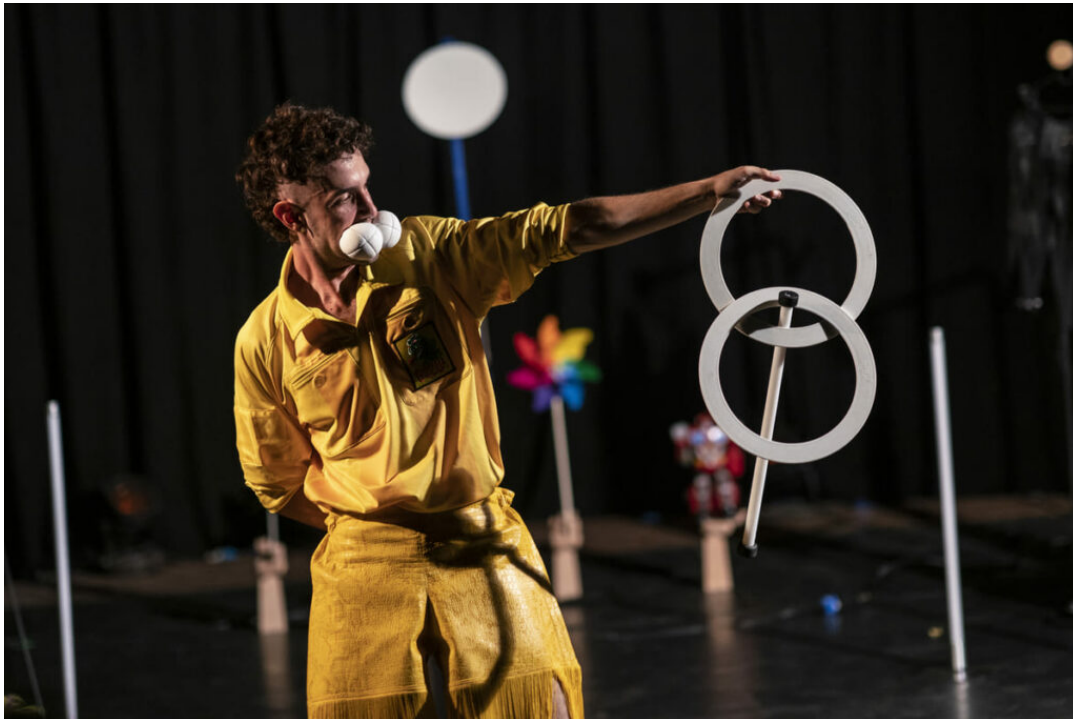
Llabyellov goes outside – Carlo Cerato- ph. Antonio La Grotta 2024- Youth Festival 2024

Torna il Festival multidisciplinare under25, dal 25 al 30 giugno al Teatro India: una grande festa pensata dai giovani per i giovani all'insegna dell'arte, dell'inclusività e del cambiamento tra eventi di teatro, circo, musica, danza, cinema, arti visive e digitali.