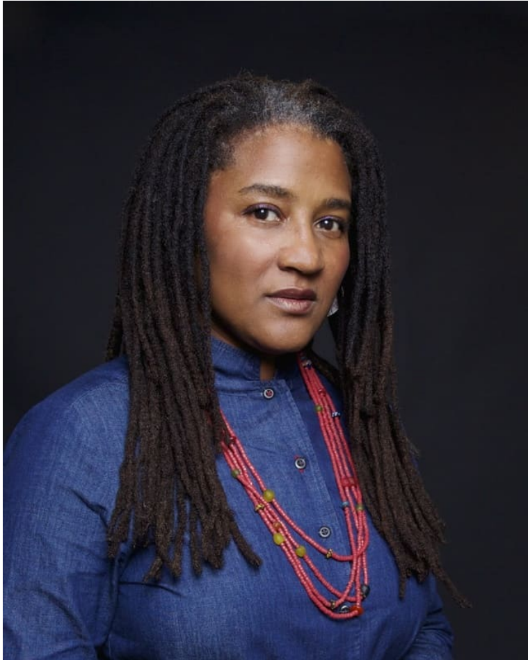
Lynn Nottage- Puf!- Youth Festival 2024

attraversando nuove forme, per incontrarsi nelle emozioni di chi ci sta accanto e confluire in un “noi” che non ha confini.