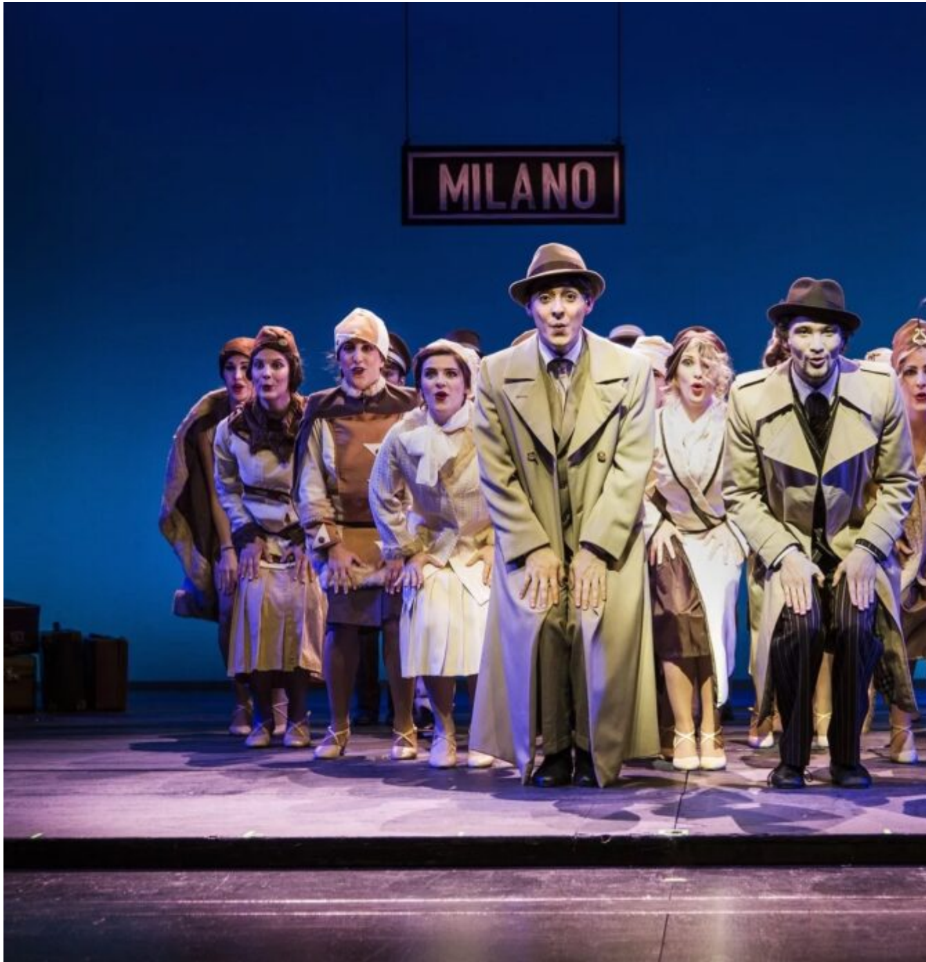
CHAPEAU IL MUSICAL

E ancora le immaginifiche creazioni di MIDSUMMER NIGHT'S CIRCUS, il musical ispirato al Sogno di una notte di mezza estate di William Shakespeare e il mondo hippy e coloratissimo di HAIR – The Tribal Love Rock Musical, nato come saggio MTS – MUSICAL! THE SCHOOL e divenuto poi spettacolo professionale di grande successo prodotto da MTS ENTERTAINMENT.